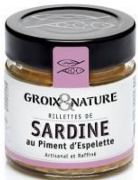
Rillettes de sardine au piment d'Espelette