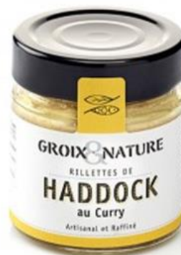
Rillettes de Haddock au curry