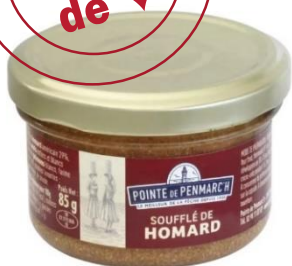
Soufflé de homard