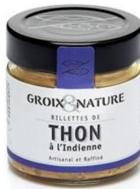
Rillettes de Thon à l'Indienne