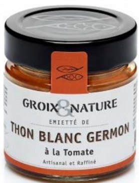
Emietté de Thon à la tomate