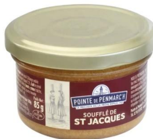
Soufflé de noix de St Jacques