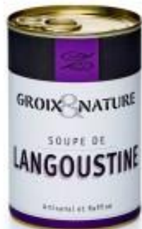
Soupe de Langoustine