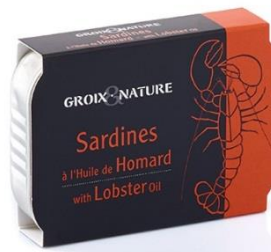
Sardines à l'huile de homard