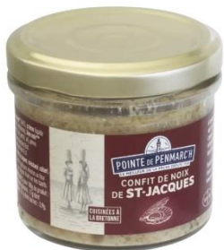
Confit de noix de St Jacques froid sur des toasts ou réchauffé